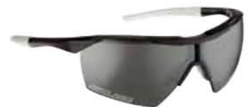
NERO - RW NERO Black - RW Black