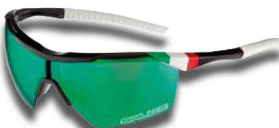
NERO - RW VERDE Black - RW Green