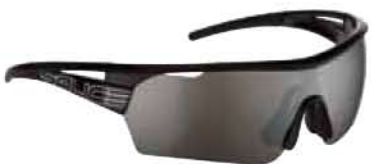
006 RW NERO - RW NERO Black - RW Black