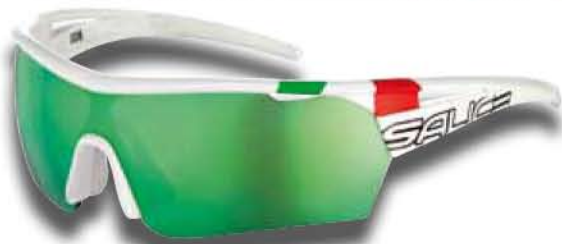
006 ITA BIANCO - RW VERDE White - RW Green