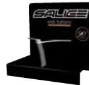
ESP 1 NERO