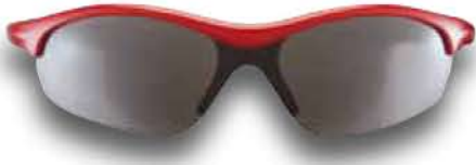
827 RW ROSSO - RW NERO Red - RW Black