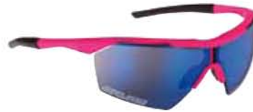
FUCSIA FLUO - RW BLU Flo Fuchsia - RW Blue