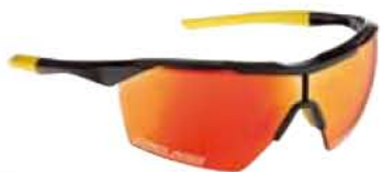
NERO - RW ROSSO Black - RW Red