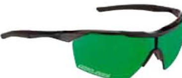
NERO - RW VERDE Black - RW Green