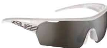
BIANCO - RW NERO White - RW Black