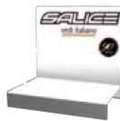
ESP 1 BIANCO