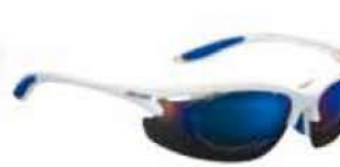
BIANCO - RW BLU White - RW Blue