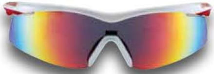
843 RW BIANCO - RW ROSSO White - RW Red