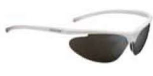
BIANCO - FUMO White - Smoke