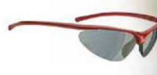
ROSSO - FUMO Red - Smoke