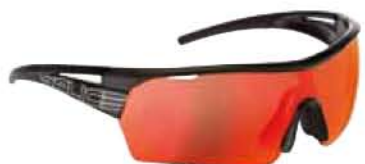
NERO - RW ROSSO Black - RW Red