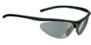
NERO - FUMO Black - Smoke