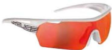
006 RW BIANCO - RW ROSSO White - RW Red