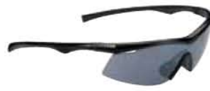
NERO - RW NERO Black - RW Black