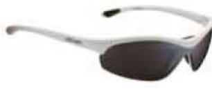
BIANCO - RW NERO White - RW Black