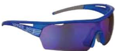
006 RW BLU - RW BLU Blue - RW Blue