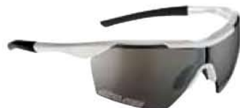
BIANCO - RW NERO White - RW Black