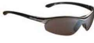
GUN - RW NERO Gun - RW Black