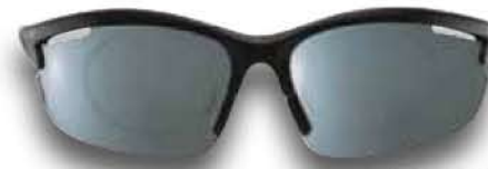
826 RW NERO - RW NERO Black - RW Black