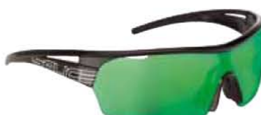
NERO - RW VERDE Black - RW Green