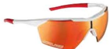
BIANCO - RW ROSSO White - RW Red