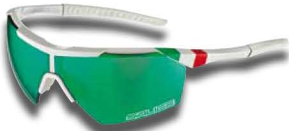
BIANCO - RW VERDE White - RW Green