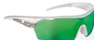
BIANCO - RW VERDE White - RW Green