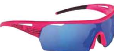
FUCSIA FLUO - RW BLU Flo Fuchsia - RW Blue