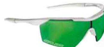
BIANCO - RW VERDE White - RW Green