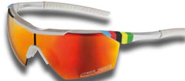
BIANCO - RW ROSSO White - RW Red