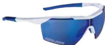
BIANCO - RW BLU White - RW Blue