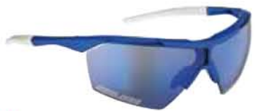
BLU - RW BLU Blue - RW Blue