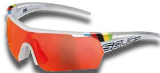
006 CDM BIANCO - RW ROSSO White - RW Red