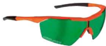
ARANCIO FLUO - RW VERDE Flo Orange - RW Green