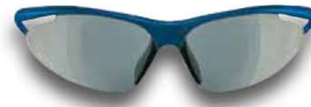
825 PC COBALTO - FUMO Blue Cobalt - Smoke