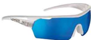
BIANCO - RW BLU White - RW Blue