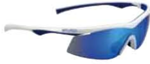
BIANCO - RW BLU White - RW Blue