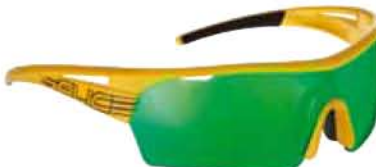
GIALLO - RW VERDE Yellow - RW Green