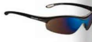
NERO - RW BLU Black - RW Blue